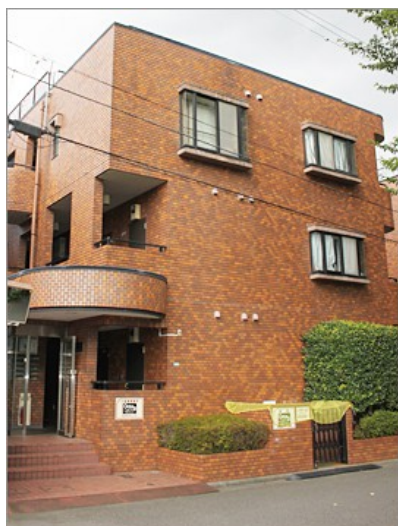
当院マンションの外観

マンション入口には、オートロックはありませんので、そのまま中に入ってください、1 階の通路を奥に入ってください、「105」号室はございます。表札やドア部分に「鍼灸院神尾」と記されております。インターホンで呼び出してください。