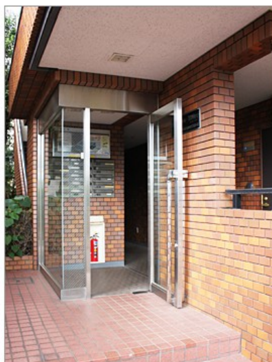
マンションの玄関